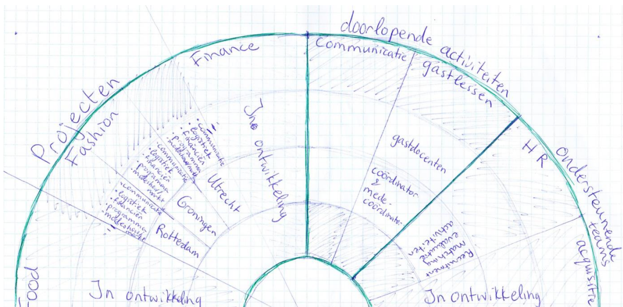
Figuur 1: Concept organogram

Concreet betekent dit dat we gaan onderzoeken wat een laag tussen het bestuur en de verschillende teams kan opleveren met het oog op de groei van de organisatie en de verbetering van de interne communicatie. In deze laag zouden we coördinatoren en projectleiders van de verschillende teams samen willen brengen om de samenwerking en afstemming over zaken als financiën en communicatie te bevorderen.